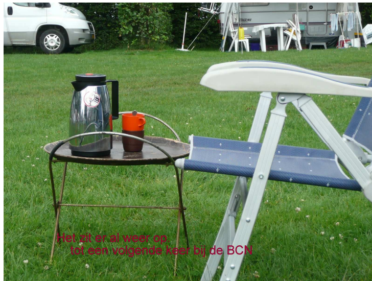
Het zit er al weer op tot een volgende keer bij de BCN

gelukkigen kregen allen een hebbedingetje met knipperlicht. De kampeiding sloot het weekend af en wensten allen wel thuis. Velen vertrokken die zondag, wij bleven nog wat langer, genietend van de 2 zeer hete dagen. Gelukkig hadden wij een schaduwrijke plek.